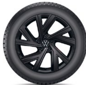
VW Bergamo Schwarz

Über detaillierte Informationen zu den Fahrzeugverwendungen, Einschränkungen und Auflagen informieren wir Sie gerne. KE = Kraftstoffeffizienz, NHK = Nasshaftungskategorie (Rollwiderstand), GE = Geräuschemission (Abrollgeräusch), GE/G = Geräuschemission Gruppe, SK-F = Schneekettenfreigabe.