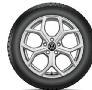
VW Huntsville Silber

Alle abgebildeten Winterkomplettäder (WKR) für den neuen Tiguan haben keine Reifendruckkontroll-Sensoren (RDKS). Falls Ihre Fahrzeugausstattung dies erfordert, sind WKR mit RDKS zu wählen. Beachten Sie bitte den Aufpreis. Ihr Volkswagen Service-Betrieb informiert Sie gerne.