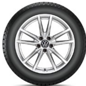
VW Pretoria Silber

in 18" mit 225/40 R18 92V XL Conti WinterContact TS 870 P statt 3.080,- mit TopCard 2.310,- KE: C | NHK: B | GE: 71 | GE/G: B | SK-F: Nein Art.-Nr. 5H007328AX1S